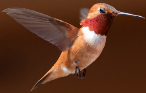
Rød dværgkolibri han. Kolibrier har en vingeslagsfrekvens på op til 75 vingeslag pr. sekund.

som ikke kendes fra andre fugle. De kan stå stille i luften, flyve lodret op og ned, ja, de er endog i stand til at flyve baglæns. Deres skulderled er kugleformet, hvilket giver fuglen mulighed for at dreje vingen 180 grader i alle retninger. Kolibrier basker ikke med vingerne, men bevæger dem i et ovalt mønster, undtagen i svæveflugt, hvor bevægelsen foregår i ottetalsmønstre.