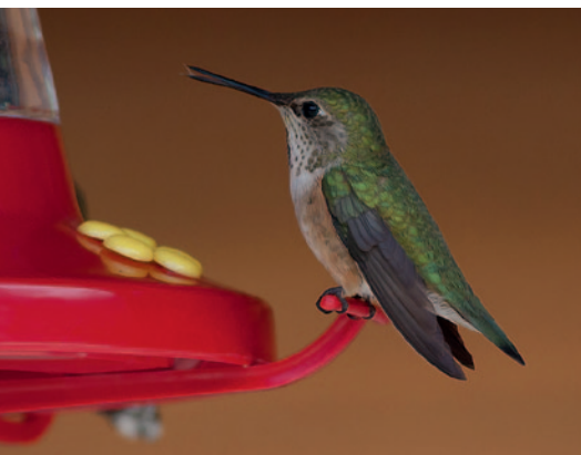
Rød dværgkolibri hun ved feederen. Tungen har en vigtig funktion ved indtagelse af føde. På tungespidsen findes børsteformede hår, som hjælper fuglen, når den slikker nektar i sig med op til 13 slik pr. sekund.

Det er meget vanskeligt at finde reder med kolibrier, dels fordi de er meget små, dels fordi de er godt camouflerede. Hvert år efter ankomst til ynglepladserne må der bygges en ny rede. Redens placering udvælges nøje. Den skal være beskyttet mod regn, blæst og kraftigt sollys og anbragt i en højde, så hverken myrer, slanger eller andre predatorer kan komme til den. Æggene røves ofte af fugle som skader, krager og jordgøge samt af små gnavere som jordegern og chipmunks. Som redemateriale vælger kolibrierne mos og laver, der bindes sammen med edderkoppespind.